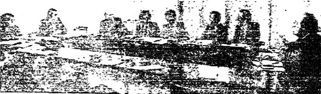
اجتماع اللجنة الاقتصادية